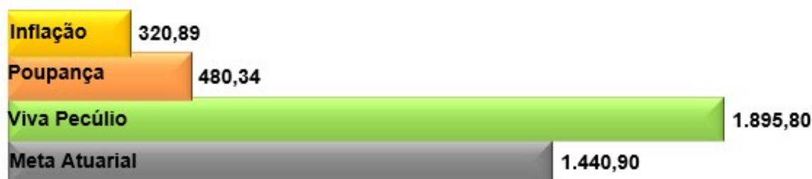
Rentabilidade acumulada - (%) (Jan/98 - Out/22)