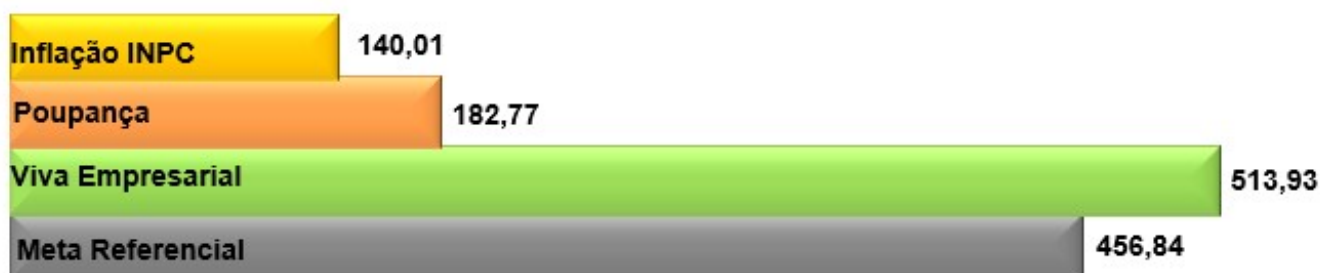
Rentabilidade acumulada no período (Jun/05 a Out/22)